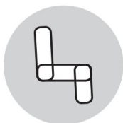
Standaard zitplaats Positie

Deze stoel beschikt over een reeks elektrisch bediende verstelmogelijkheden die met de afstandsbediening kunnen worden bediend, met name: